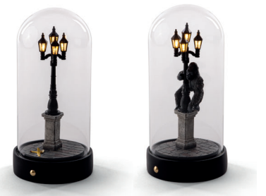
MY LITTLE CORNER_10466 MY LITTLE KONG_10465

Этот прибор нельзя утилизировать вместе с бытовыми отходами. Это устройство имеет маркировку в соответствии с Директивой ЕС 2012/19/EU об отходах электрического и электронного оборудования (WEEE). Эта директива определяет правила сбора и переработки утилизованного электрического оборудования, действующие на всей территории Европейского Союза. Для возврата утилизованного устройства используйте системы возврата и сбора, доступные в отдельных странах использования.