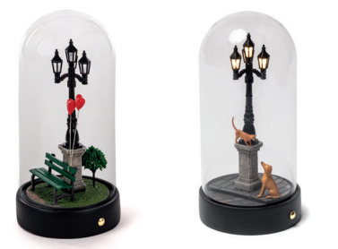
MY LITTLE VALENTINE_10469 MY LITTLE EVENING_10464