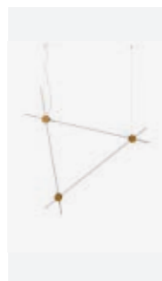
Suspension, p. 104