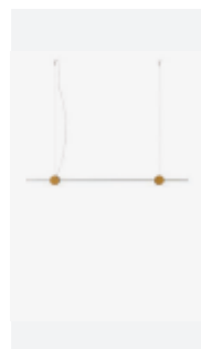
Suspension, p. 96