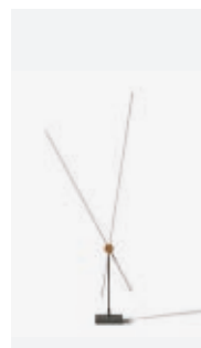
Floor, p. 70