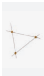
Wall, p. 142