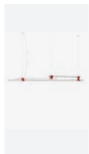
Suspension, p. 100