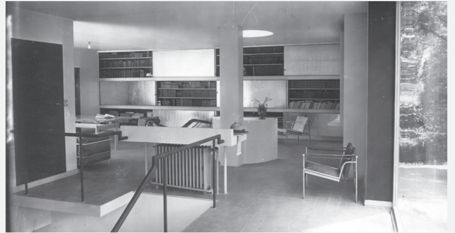
Mobilier de la Villa Church, Ville d'Avray, 1928 © Le Corbusier, Pierre Jeanneret, Charlotte Perriand /ADAGP.