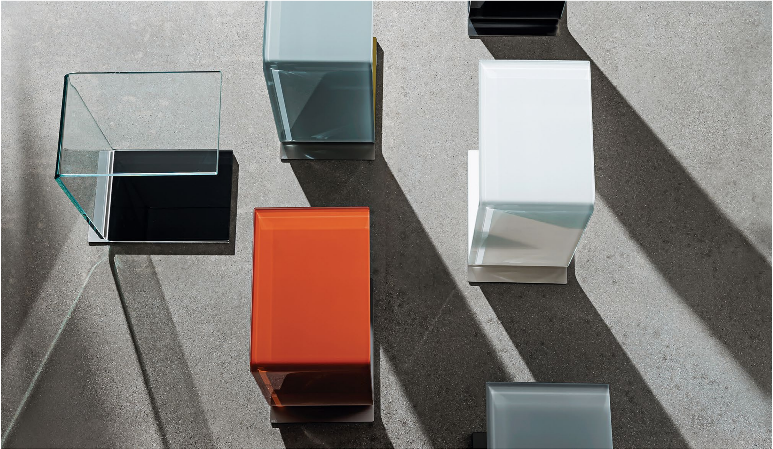
Swan TETE-TEN1, TER4, TEB1