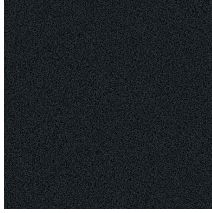
GN Embossed black Nero gofrato