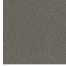
GT Embossed clay Caffè gofrato