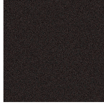
GC Embossed Mocha Caffè gofrato