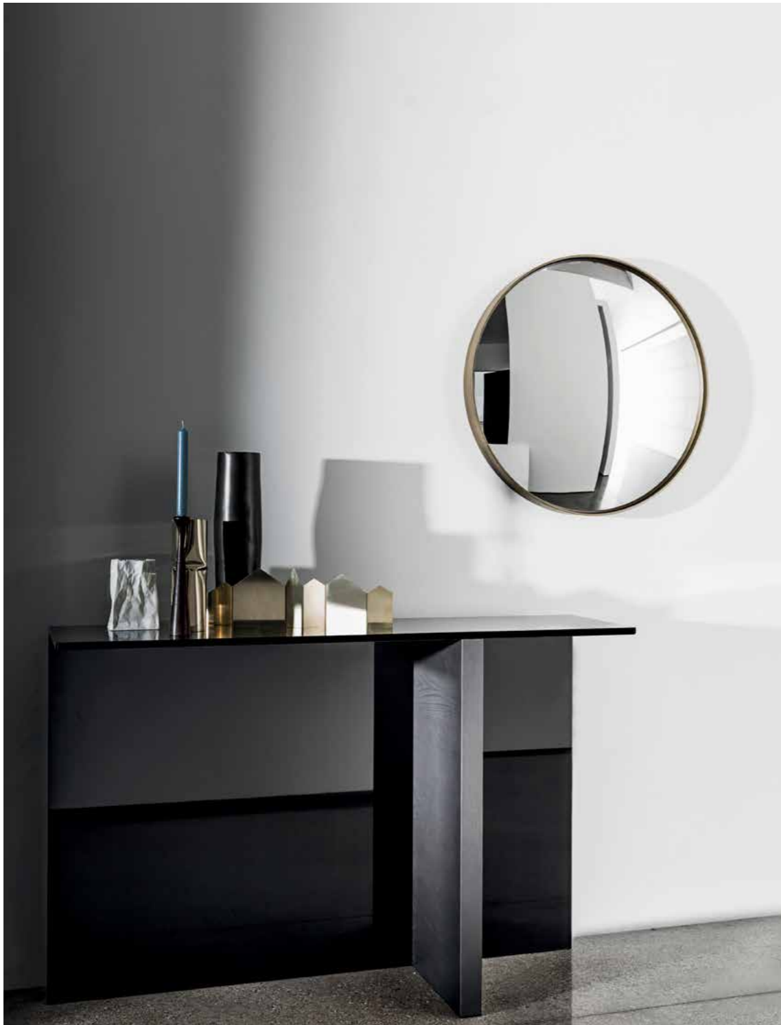
Sail mirror structure BR. Regolo console structure WG and TEN1 top TFTF.