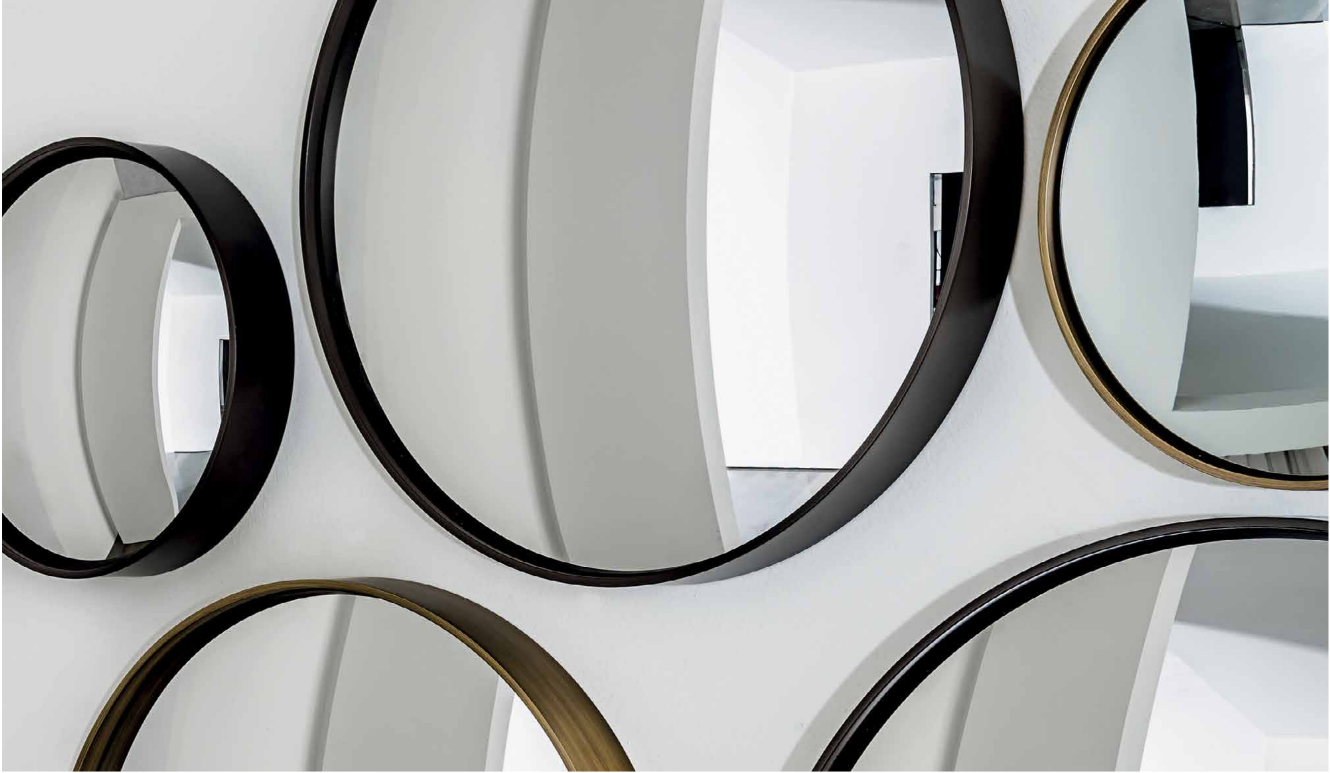
Sail mirrors composition.