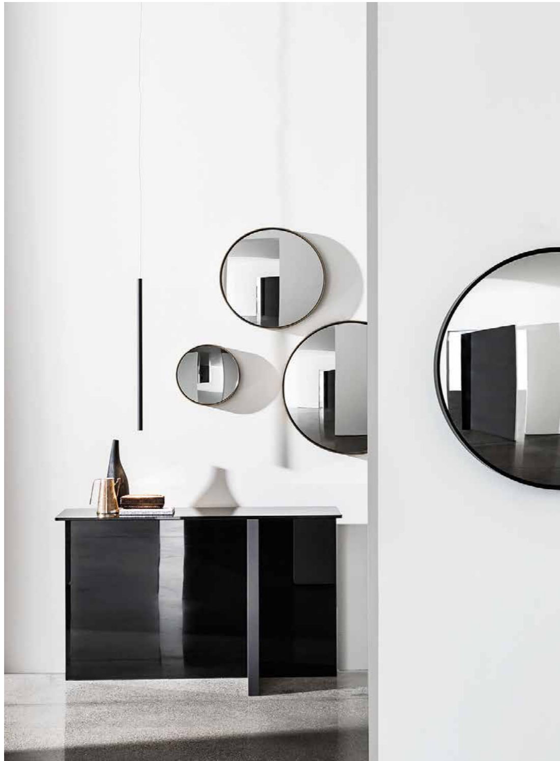
Sail mirrors structure BR and GC. Regolo console elements WG and TEN1 top TTF.