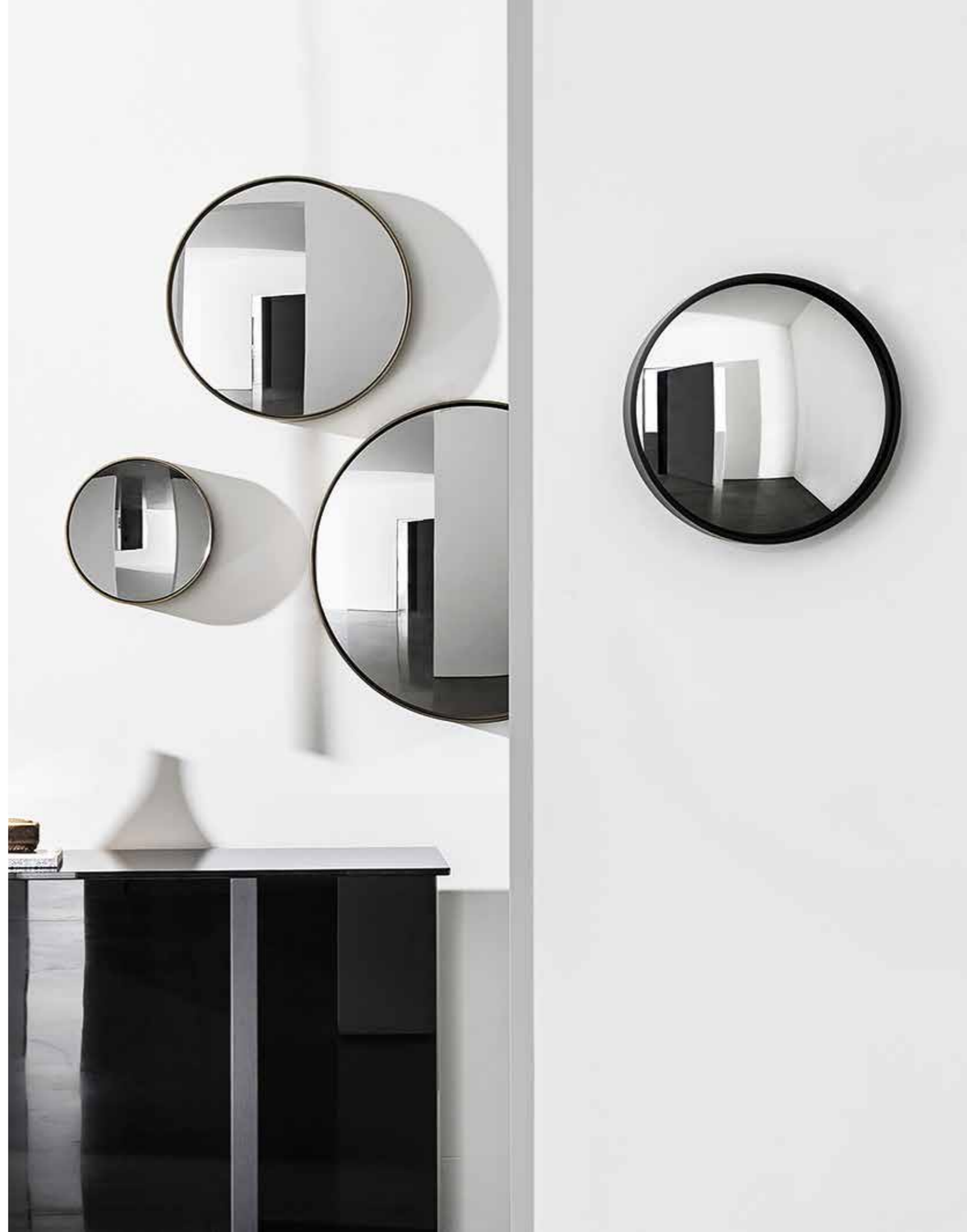
Sail mirrors structure BR and GC. Regolo console structure WG and TEN1 top TFTF.