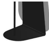
GN Embossed black Nero goffrato

★ Gli specchi oro e rosa potrebbero presentare delle piccole imperfezioni dovute alle caratteristiche tecniche del materiale. Non possono essere utilizzati in luoghi umidi. Pulire solo con panni asciutti. Gold and rose mirrors could have small imperfections due to the particular technical characteristics of the material. We recommend not to use them in damp areas. Clean only with a dry cloth.