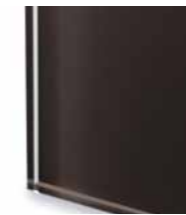
TEC1 Extralight glass lacquered mocha Vetro extrachiaro laccato caffè