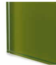
TEV2 Extralight glass lacquered moss green Vetro extrachiaro laccato col. muschio