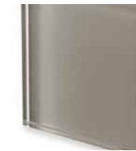
TEC2 Extralight glass lacquered clay Vetro extrachiaro laccato creta