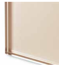
* TES1 Vetro extrachiaro laccato champagne Extralight glass lacquered champagne