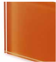
TER4 Extralight glass lacquered rust Vetro extrachiaro laccato col. ruggine