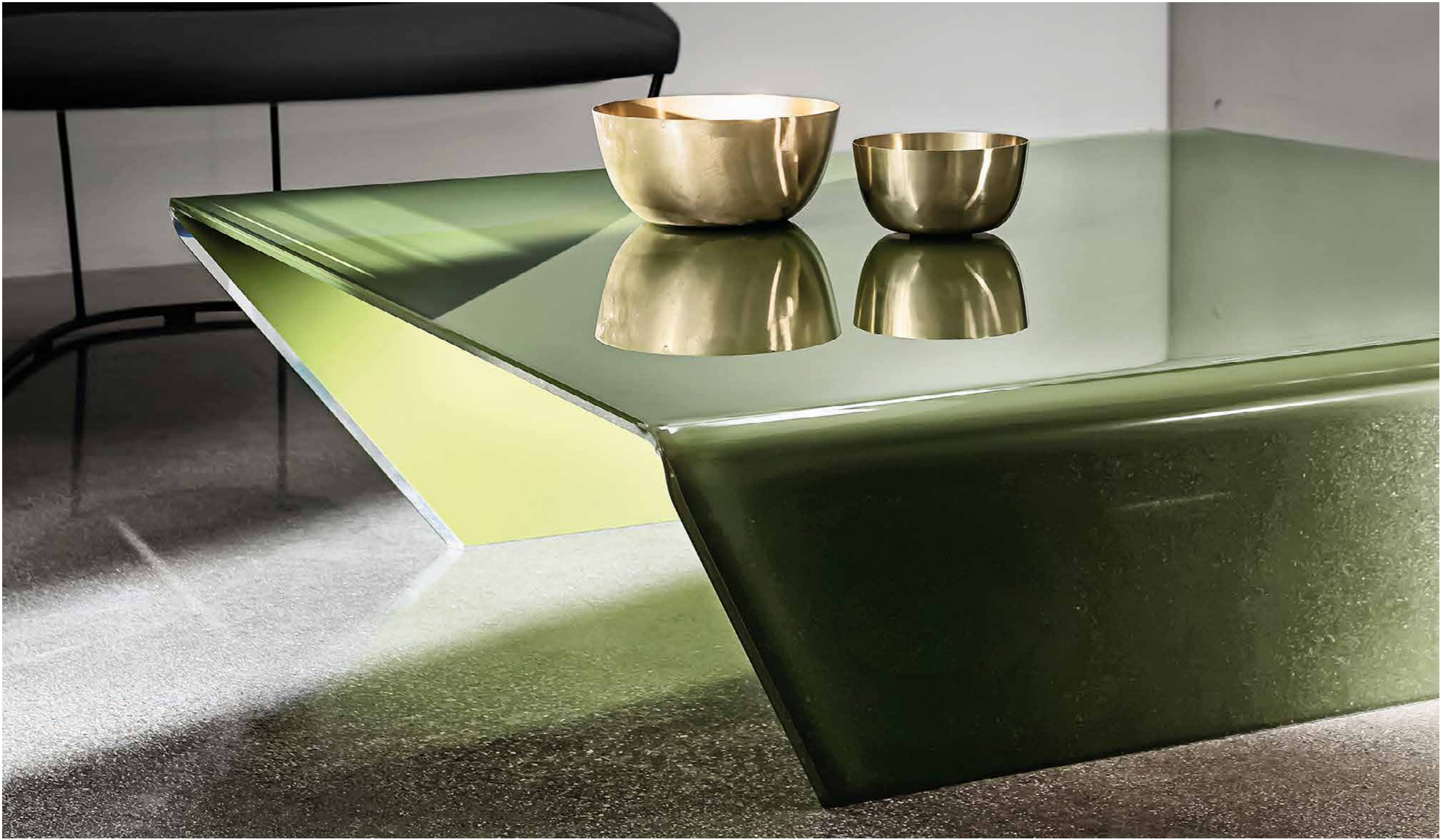
Rubino coffee tables TEV2