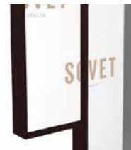
GC Embossed mocha Goffrato caffè