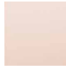
SRSP ★ Rose mirror Specchio rosa