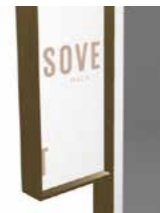
BR Burnished metal Metallo brunito

★ Gli specchi oro e rosa potrebbero presentare delle piccole imperfezioni dovute alle caratteristiche tecniche del materiale. Non possono essere utilizzati in luoghi umidi. Pulire solo con panni asciutti. Gold and rose mirrors could have small imperfections due to the particular technical characteristics of the material. We recommend not to use them in damp areas. Clean only with a dry cloth.