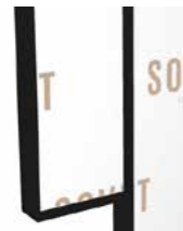
GN Embossed black Goffrato nero