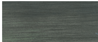
metallo brunito spazzolato a mano hand-finished burnished metal