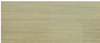
metallo ottonato satinato satin brass-coated metal