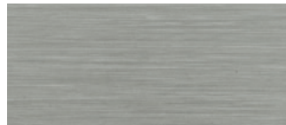
metallo nichelato satinato satin nicked metal