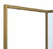
BR Burnished metal Metallo brunito