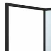
GN Embossed black Nero goffrato