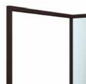
GC Embossed Mocha Caffè goffrato