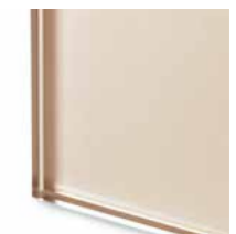
* TES1 Vetro extrachiaro laccato champagne Extralight glass lacquered champagne