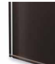
TEC1 Extralight glass lacquered mocha Vetro extrachiaro laccato caffè