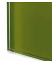
TEV2 Extralight glass lacquered moss green Vetro extrachiaro laccato col. muschio