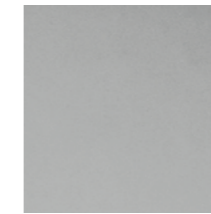
SFAC Frosted smoked mirror Specchio fumé acidato