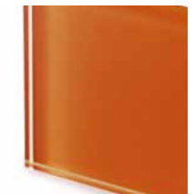
TER4 Extralight glass lacquered rust Vetro extrachiaro laccato col. ruggine