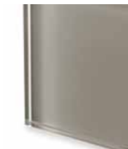
TEC2 Extralight glass lacquered clay Vetro extrachiaro laccato creta