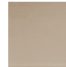
SBAC Frosted bronzed mirror Specchio bronzo acidato