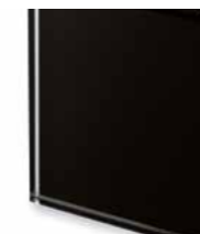
TEN1 Extralight glass lacquered black Vetro extrachiaro laccato nero