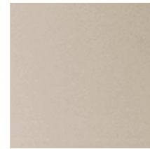
SBSP Bronzed mirror Specchio bronzo