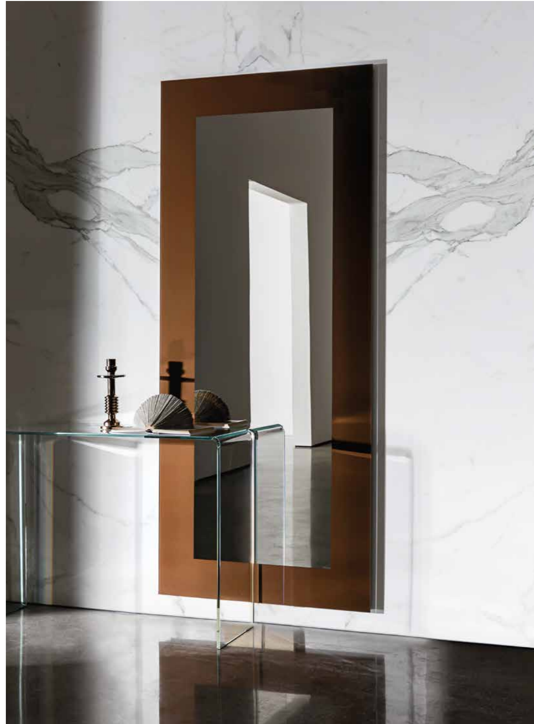
Campos coffee table P4793 Ø 80x35h structure GN top CL.