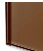
* TEM6 Vetro extrachiaro laccato col. tabacco Extralight glass lacquered tobacco