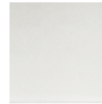
SEAC Frosted extralight mirror Specchio extrachiaro acidato