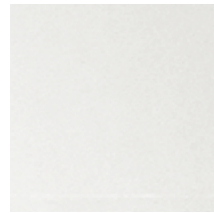
SESP Extralight mirror Specchio extrachiaro