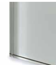
TEC3 Extralight glass lacquered cement Vetro extrachiaro laccato col. cemento