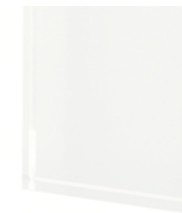
TEB1 Extralight glass lacquered milky white Vetro extrachiaro laccato bianco latte